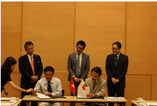
贈与契約に署名をする日田総領事(右)と ハウザン省フンヒェップ県総合病院クアン院長