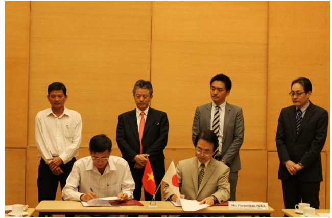
贈与契約に署名をする日田総領事(右)とロンアン省 ヴインフン県建設案件管理委員会チャウ委員長