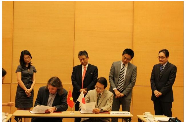
贈与契約に署名をする日田総領事(右)と サイゴンチルドレンズチャリティー・フィニス会長