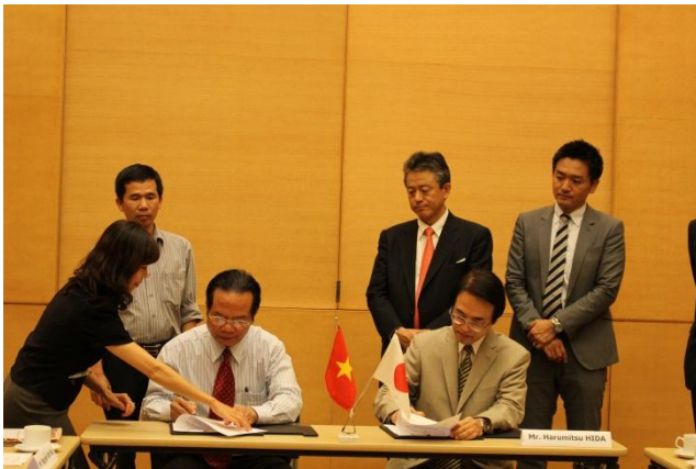
贈与契約に署名をする日田総領事(右)と ラムドン省教育訓練局ゴック局長