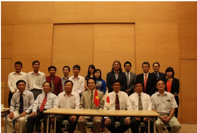
8団体との記念撮影