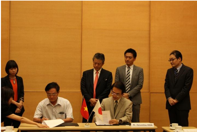
贈与契約に署名をする日田総領事(右)と ビンフォック省ブードップ県総合病院クーン院長