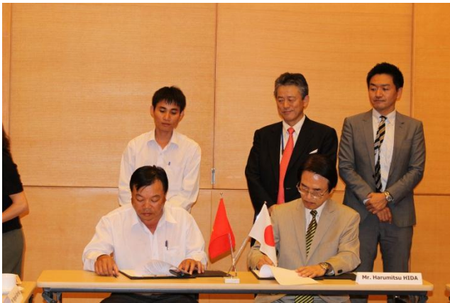
贈与契約に署名をする日田総領事(右)と ビントゥアン省ドゥックリン県人民委員会フイ副委員長