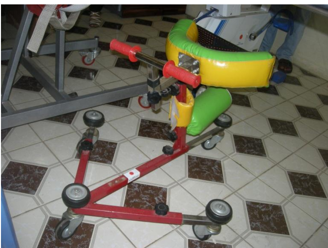
Xe mũi tên tập đi bại não do dự án tài trợ