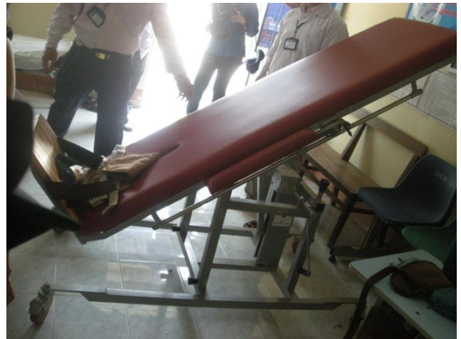
Bàn xoay quay do dự án tài trợ