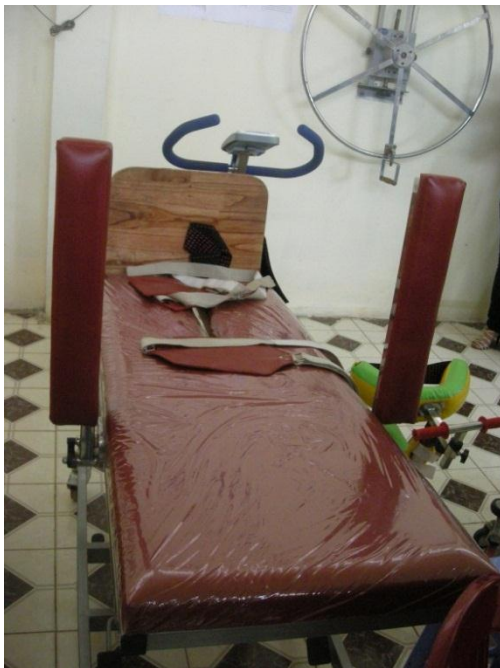
Giường điều trị do dự án tài trợ