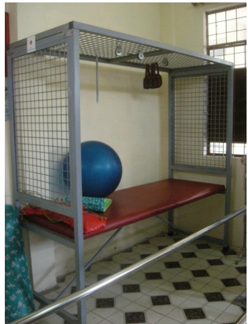
Lồng điều trị đa năng kéo bằng ròng rọc do dự án tài trợ