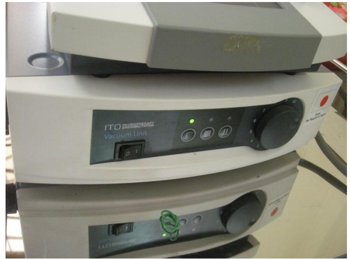
Máy giác hút chân không 2 kênh tự cấp nguồn có thể kết nối với tất cả các thiết bị kích thích điện do dự án tài trợ