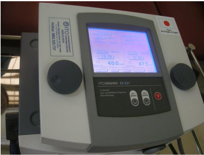
Máy điện trị liệu 2 kênh đa năng do dự án tài trợ