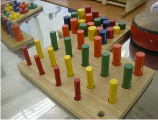
Một số dụng cụ tập hoạt động vật lí trị liệu do dự án tài trợ