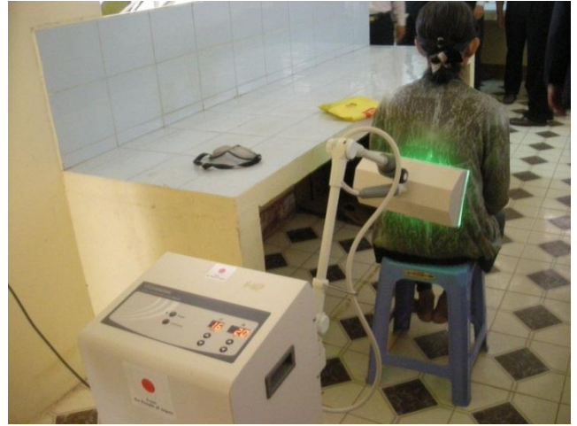
Máy vi sóng trị liệu chế độ xung và liên tục do dự án tài trợ