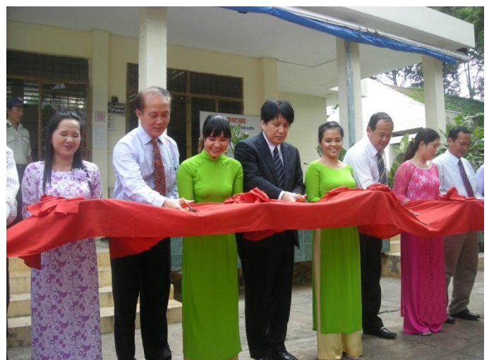
Cắt băng bàn giao tại buổi lễ