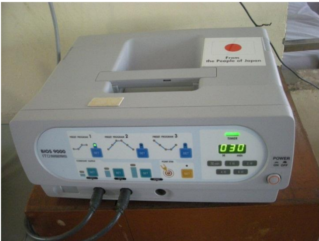
Máy điều trị từ trường trị liệu toàn thân với giường điều trị bằng gỗ do dự án tài trợ