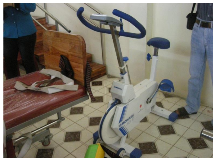
Xe đạp lực kế do dự án tài trợ